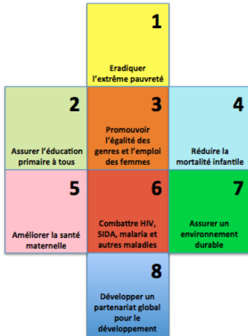
Figure 2. Une synthèse des huit objectifs

Les indicateurs de développement retenus dans la démarche du millénaire correspondent à ces 8 objectifs, concernent 18 cibles, dont l'atteinte est évaluée à partir de 48 indicateurs.